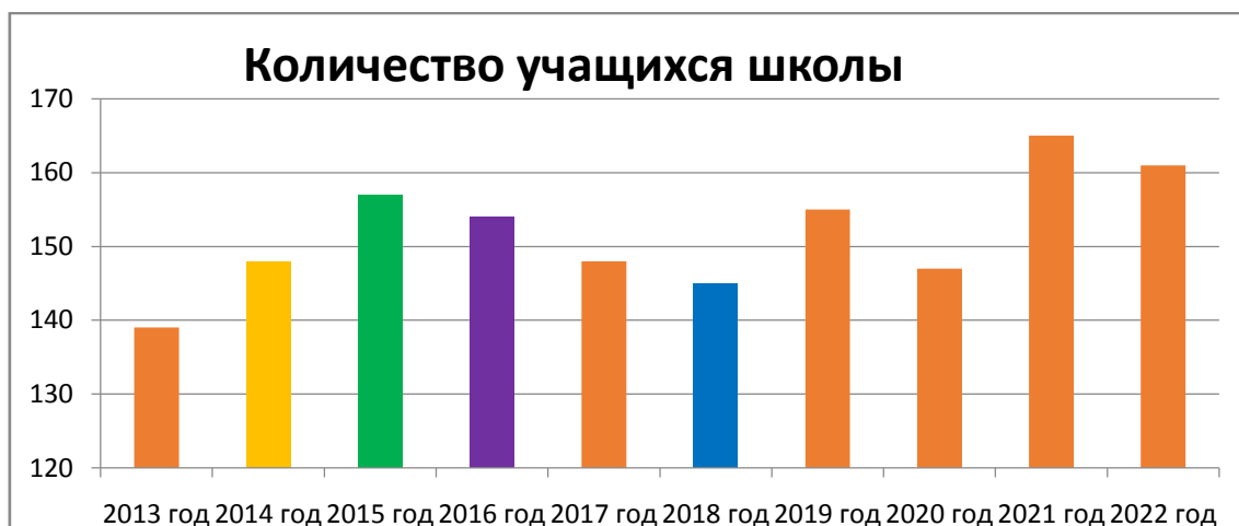
Диаграмма 1. Динамика изменения количества обучающихся (за последние 7 лет)

В диаграмме 1 видно, что количество обучающихсяросло: на начало 2021 года -165, в настоящий момент у нас обучается 161 ребенок.